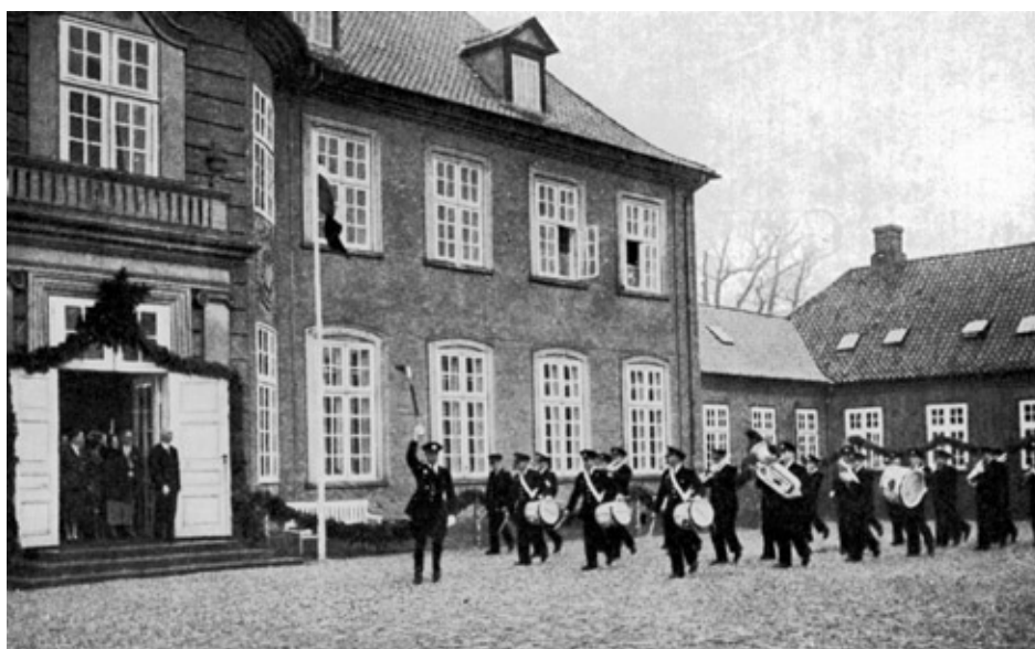
Odense Politiorkester foran Langesø Slot

I foråret 1956, da jeg havde vagt på banegården i Odense, kom lensbaronen derind, og han kom hen og hilste på mig. Vi kom i samtale om guldbrylluppet, og jeg spurgte herunder, hvor mange meter guirlander der var bundet og ophængt i gården i forbindelse med den store æresport.