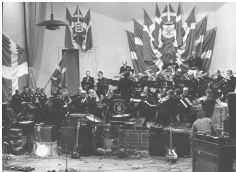
O.P.O. i Fyens Forsamlingshus 1977